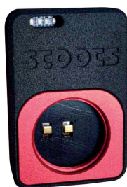
Notice chargeur easyLock 18